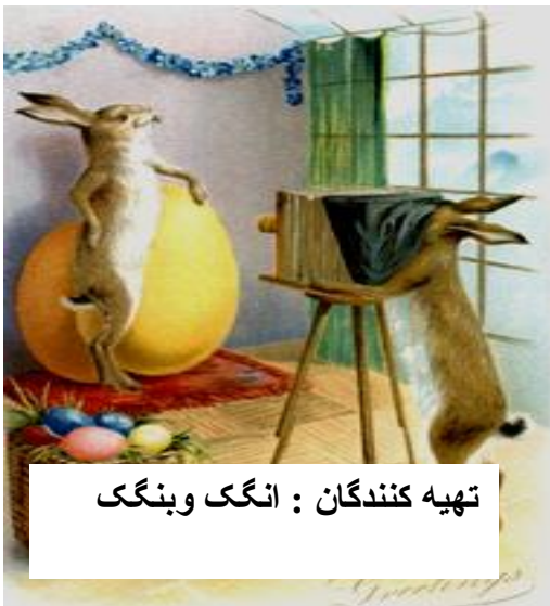
تهیه کنندگان : انگک و بنگک

"گلاب زوی" باز ده کار باشه به ما چی به "کرزی" دوست و یار باشه به ما چی از آنروزی که گشته "نوکر روس" وجودش ننگ و عار باشه به ما چی!!!